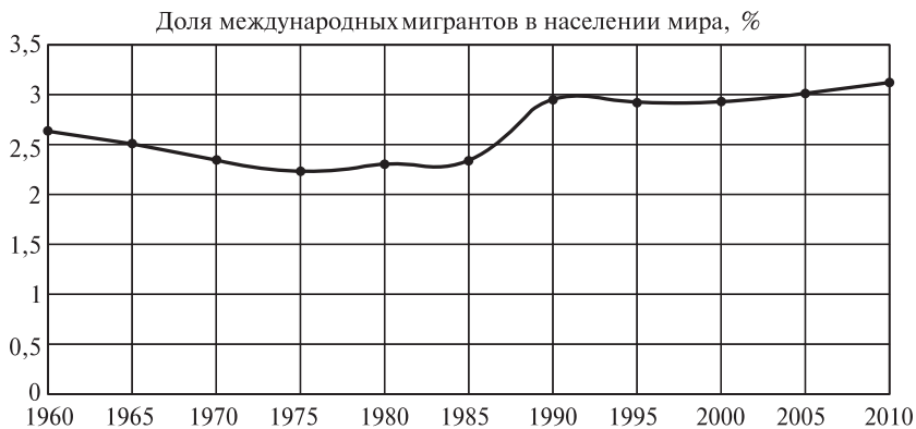
Рис. 1. Доля международных мигрантов в населении мира (1960–2010), %

Анализ. Более ранние работы показали, что доля международных мигрантов в населении мира оставалась достаточно стабильной на протяжении второй половины XX в. 14 Однако данные Всемирного банка позволяют считать такое утверждение чрезмерными упрощением, поскольку в динамике этого показателя в течение рассматриваемого периода можно выделить три довольно отчетливых периода: в 60-е годы доля мигрантов в населении мира снизилась с 2,6 до 2,3% (по всей видимости, за счет постколониальной динамики и остаточных последствий разделения Индии в 1947 г.), затем оставалась на этом уровне до середины 80-х годов, после чего резко выросла почти до 3% всего за 5 лет. Наиболее очевидным объяснением здесь представляется распад СССР и «парад суверенитетов», в результате которого значительное число людей, никогда не выезжавших за пределы СССР, оказались рожденными в других странах (бывших союзных республиках) и стали формально подпадать под определение статуса мигрантов. Однако если бы дело было только в этом, доля международных мигрантов в населении мира после резкого «всплеска» должна была бы пойти на убыль. В реальности же наблюдалась прямо противоположная картина: доля мигрантов с тех пор не опускалась ниже 3% и несколько выросла на протяжении 2000-х гг. (рис. 1).